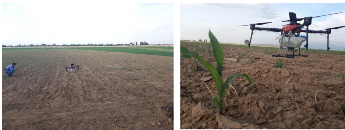
Рисунок 3 – Мониторинг и обработка полей с использованием БПЛА

Против крестоцветных блошек впервые были проведены обработки биологическими препаратами Актарофит, Грeen Голд 0,3% и Экстрасол с использованием беспилотного летательного аппарата (рисунок 3).