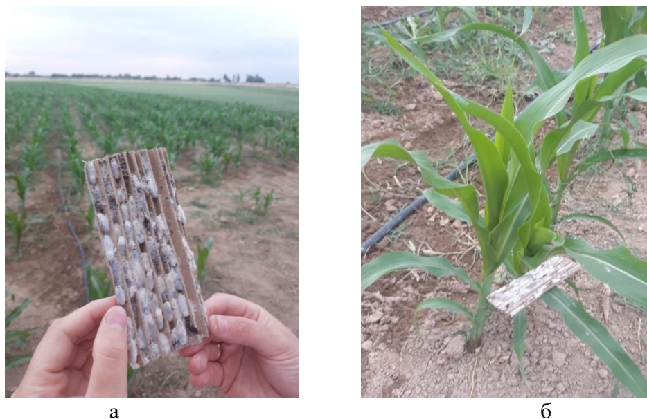
Рисунок 4 -

92,5 – 100%. При этом процент зараженности болезнями был на уровне 0,8 – 1,7%, против 97,5% в контроле.