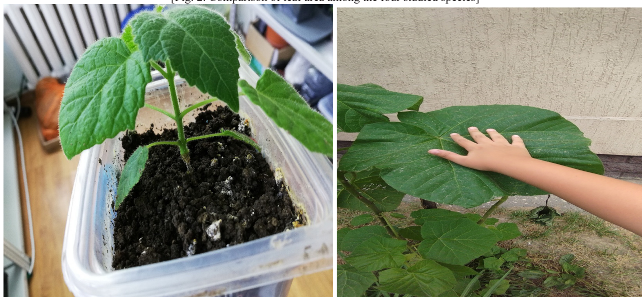
Рис. 3. Лист Paulownia tomentosa , выращенный в лабораторных условиях, полученный путем культуры in vitro: А- возраст 2 недели; Б-