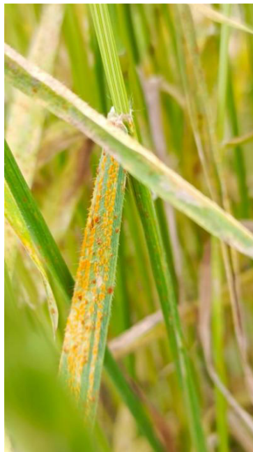
Рис. 1. Иммунологическая оценка селекционных линии озимой пшеницы на устойчивость к фитопатогенам: а – урединиоспоры желтой ржавчины ( Puccinia striiformis f. sp. tritici ) и бурой ржавчины ( Puccinia triticina f. sp. tritici )

В ходе анализа динамики фитопатогенной нагрузки в 2022–2025 гг. установлены вариабельная динамика показателей у исследованных возбудителей болезней – Puccinia striiformis , Puccinia triticina и Tilletia tritici . Анализ включал Фактор 1 (вид патогена), Фактор 2 (генотип пшеницы – линии) и Фактор 3 (год наблюдения) для оценки интенсивности поражения (таблица 2).