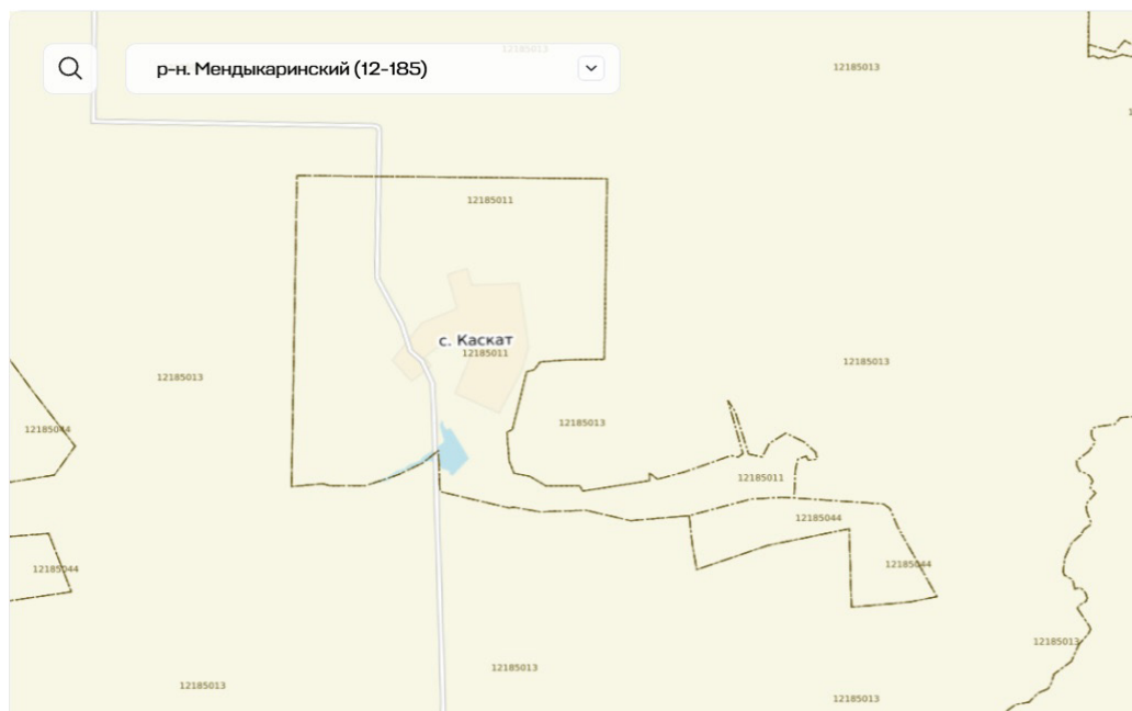
Рис. 2. Земельно-кадастровая схема с портала ЕГКН

Использовались деревянные межевые знаки длиной 1,5 м и шириной 12 см, устанавливаемые на глубину не менее 0,5 м, с курганом высотой 0,5 м и окопкой диаметром около 1,2 м. Нумерация межевых знаков осуществлялась по часовой стрелке, начиная с северной точки границы (рисунок 4).