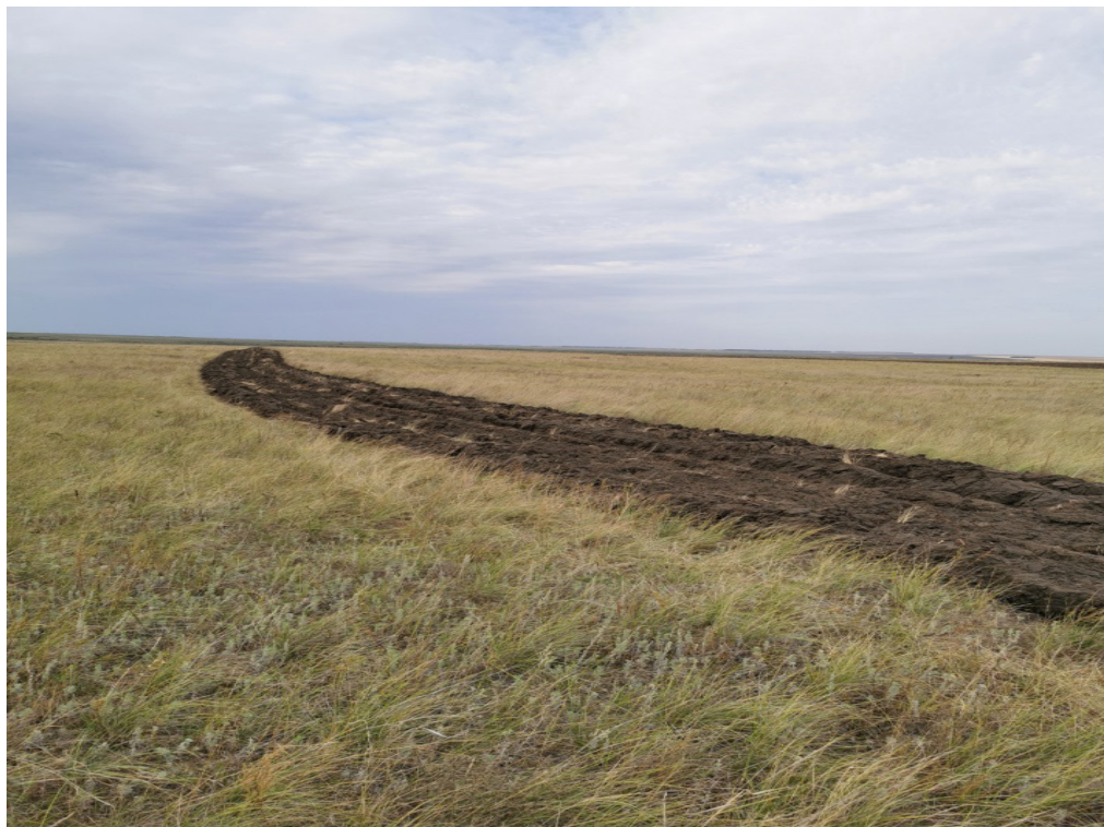
Рис.5. Пропашка по линии границы населенного пункта

Выполнена пропашка между установленными межевыми знаками, по линии границы перенесенной на местность АТЕ. Пропашка границ произведена плугом, глубиной пропашки 20 см. Вдоль естественных рубежей как водные барьеры, овраги, лесные массивы ввиду невозможности проведения пропашки не производились.