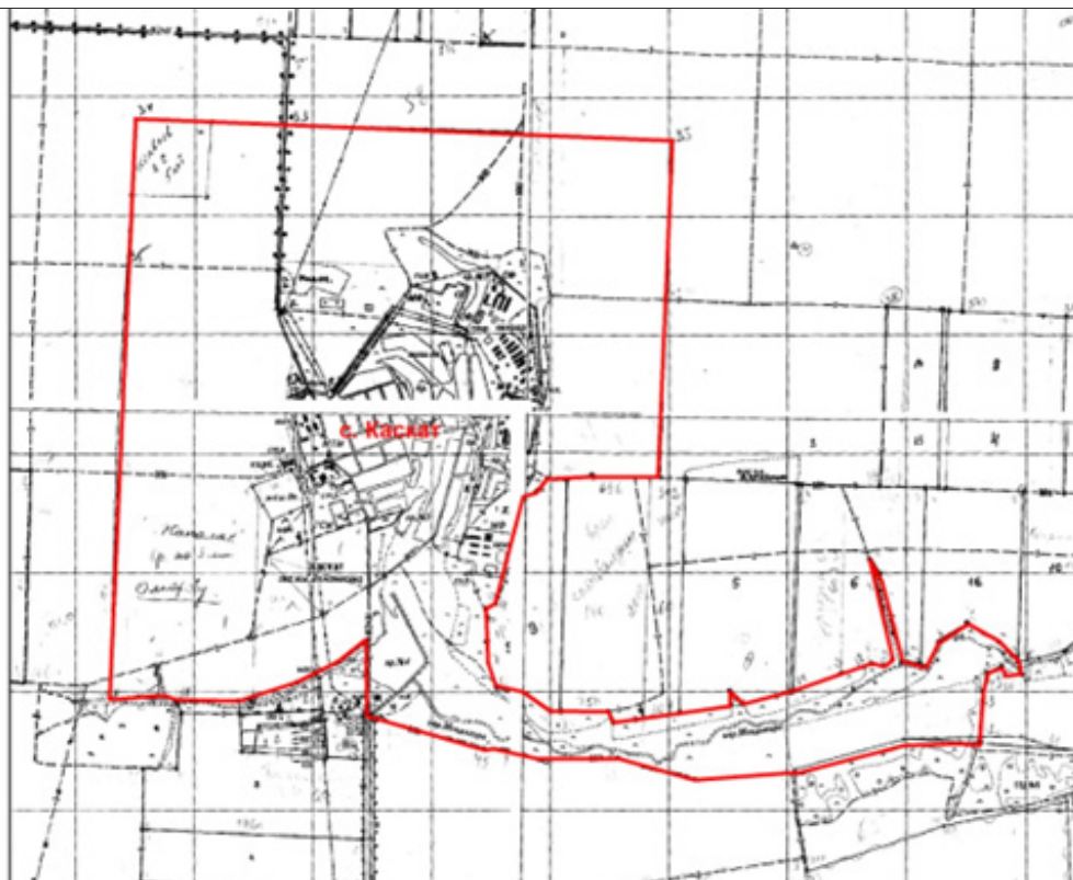
Рис. 1. План границы населенного пункта из архивных документов