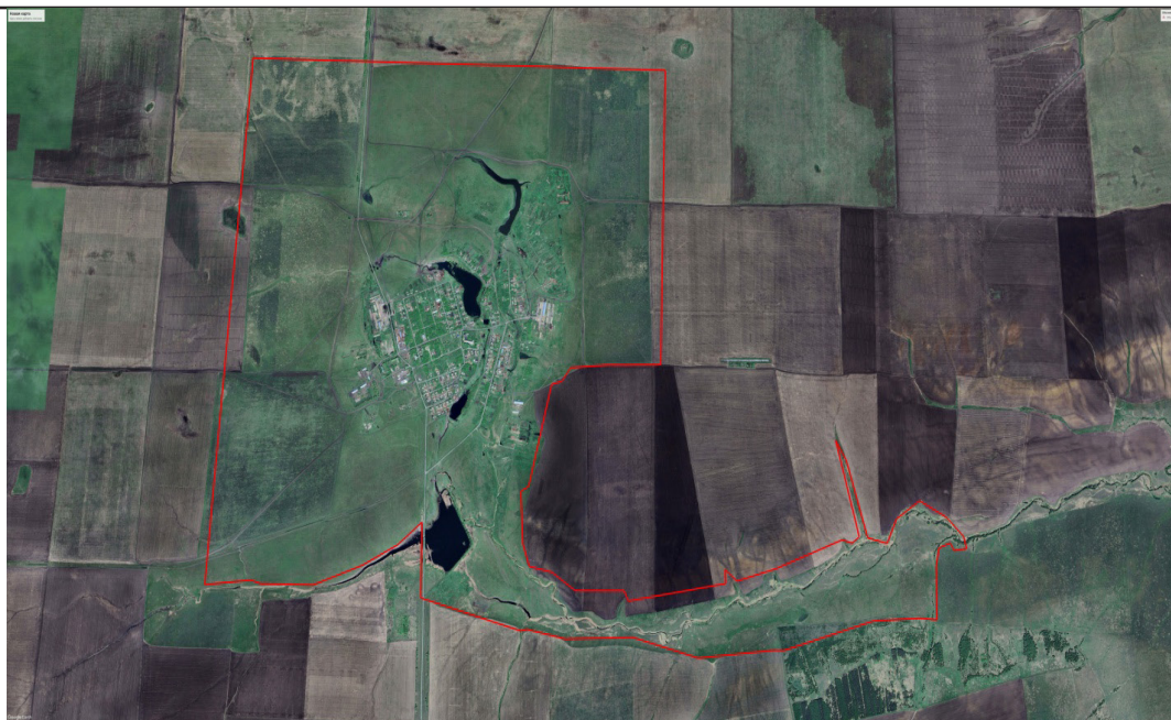
Рис.3. Схема полевого обследования земельного участка по установлению границ села Каскат