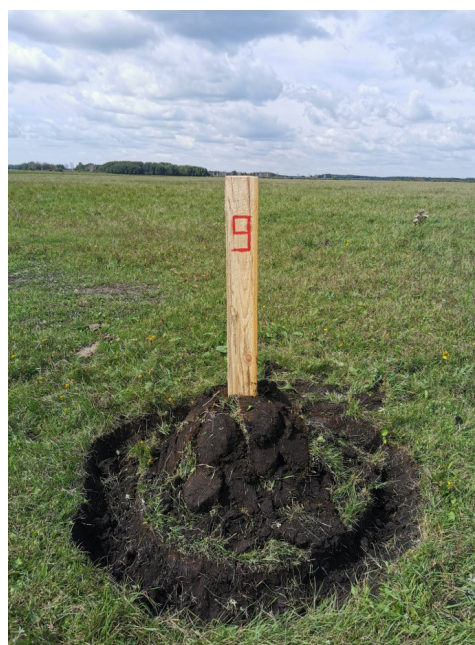
Рис.4. Установленные межевые знаки

После закрепления межевых знаков выполнена пропашка по линии границы с глубиной до 20 см. Пропашка вдоль естественных препятствий (водные барьеры, овраги, лесные массивы) не производилась по техническим причинам (рисунок 5).