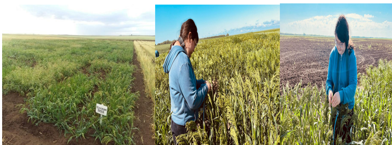
Fig. 1. Process of Y(II) measurement with MINI-PAM-II in the field

Agrotechnical operations were carried out according to the technology recommended for the region. The selection material was sown mechanically using an SSFK-7 seeder at a rate of 300 seeds per square meter in two repetitions. Sowing order was the following: the distance between sowings was 10 cm, the depth did not exceed than 5 cm, there were 18 sowings per row. The standard variety (Saratovskoye 6) was planted at the beginning of the first row and at the end of the last row. For some varieties, manual sowing was chosen with a frequency of 50 seeds per square meter due to the small number of seeds of the corresponding variety in the collection. Photosynthetic activity was measured during the phases of tillering, panicle emergence, maturity. Measurements of Y (II) were taken with MINI-PAM-II portable fluorometer, leaves of 10 random plants were measured for each sample variety (Figure 1).