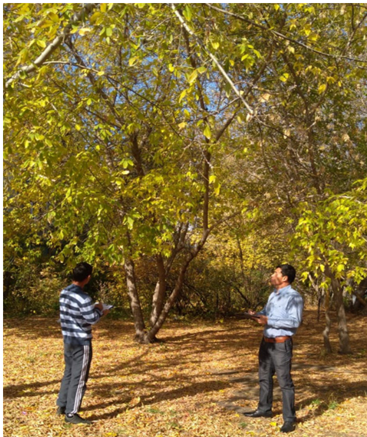
Fig. 2. Description of the biometric characteristics of woody plants in the experimental plot